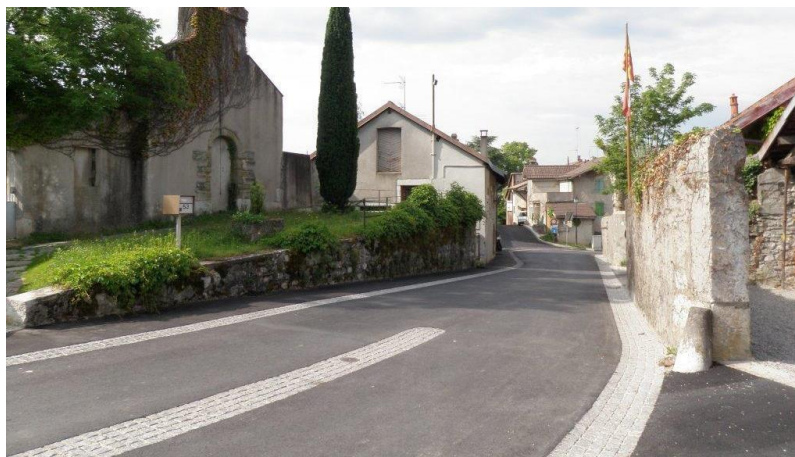
Rampe de Chouilly après les travaux