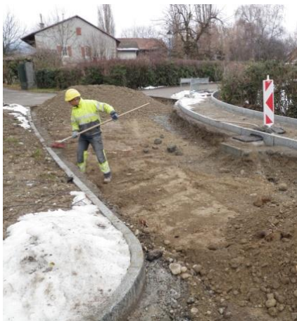
Pendant le chantier