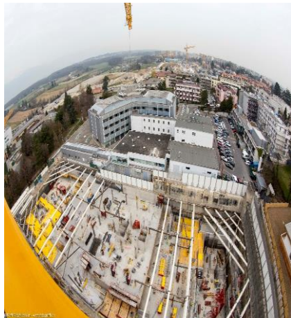
Pendant les travaux