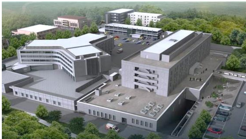
Après les travaux