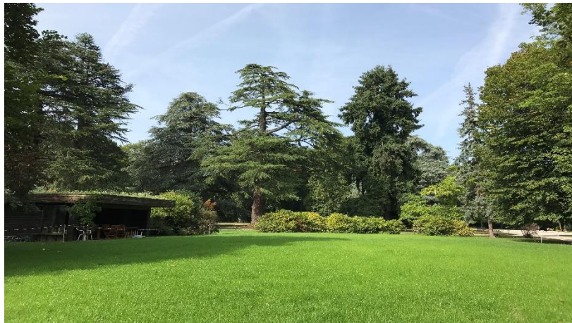
Rendu final après engazonnement