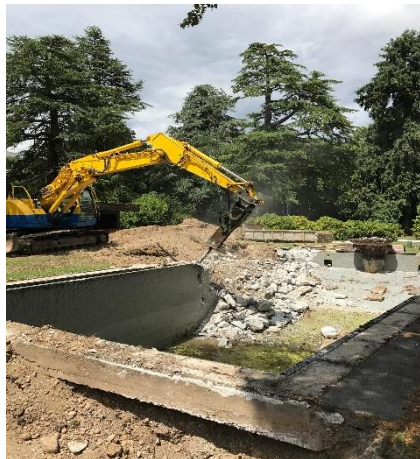
Démolition de la piscine