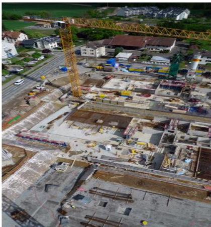
Pendant les travaux