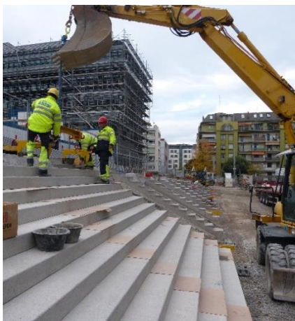
Pose des escaliers