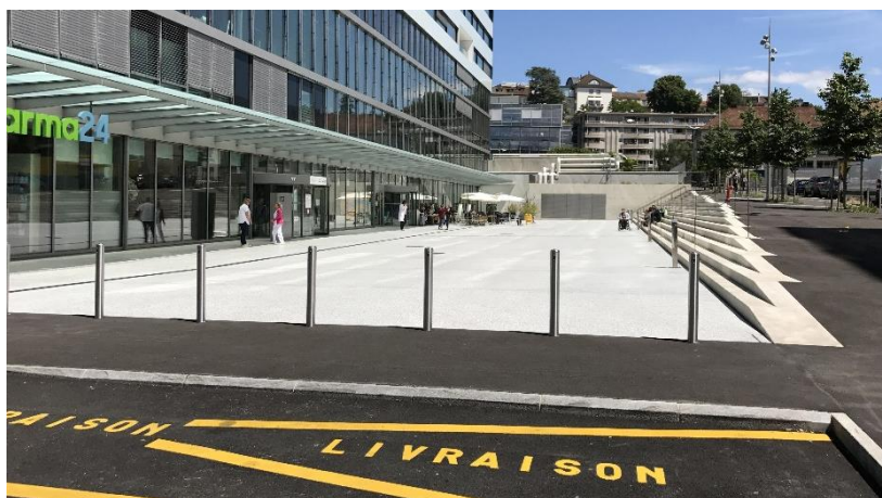
Gradins-escaliers préfabriqués sur esplanade