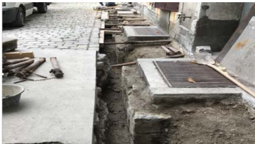
Pendant les travaux de fouille