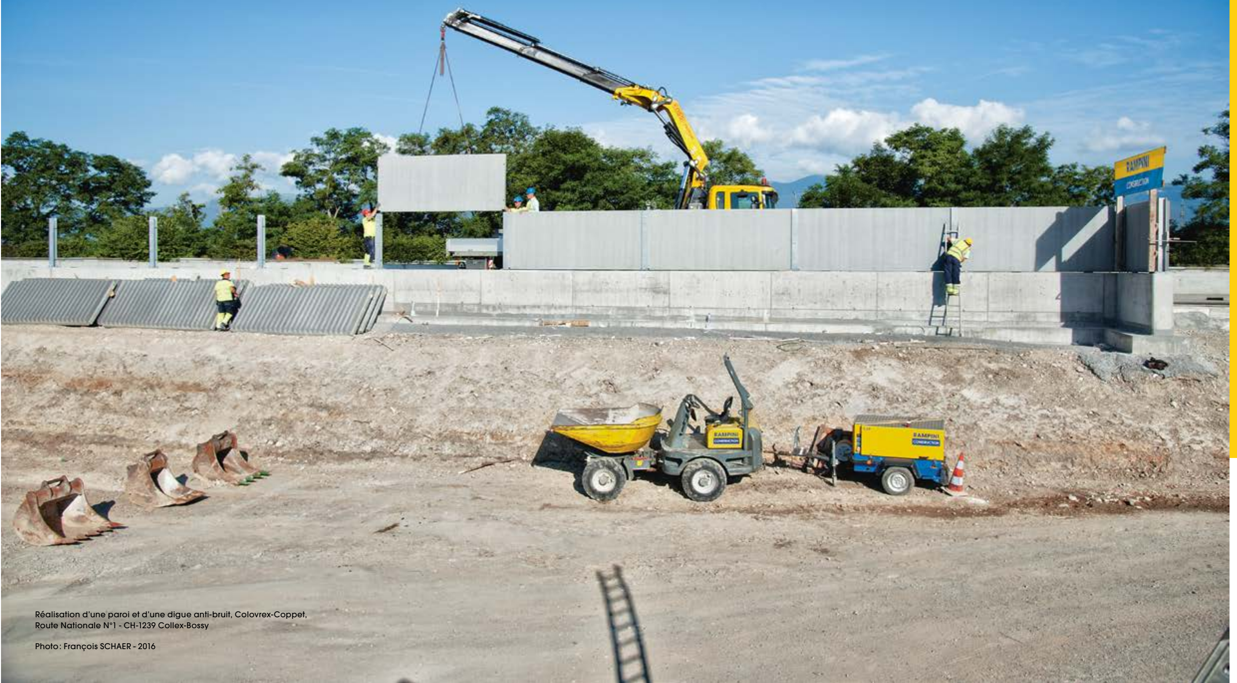
Réalisation d'une paroi et d'une digue anti-bruit, Colovrex-Coppel, Route Nationale N°1 - CH-1239 Collex-Bossy Photo: François SCHAER - 2016