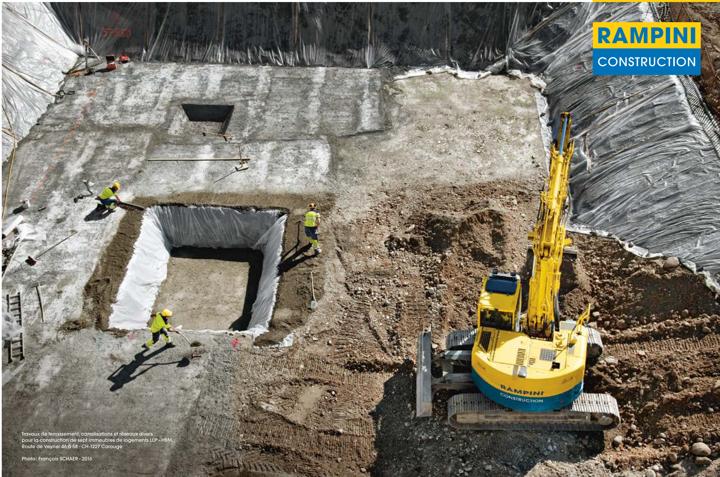
Travaux de terrassement, canalisations et réseaux divers pour la construction de sept immeubles de logements LUP - HBM, Route de Veyrier 46 à 58 - CH-1227 Carouge