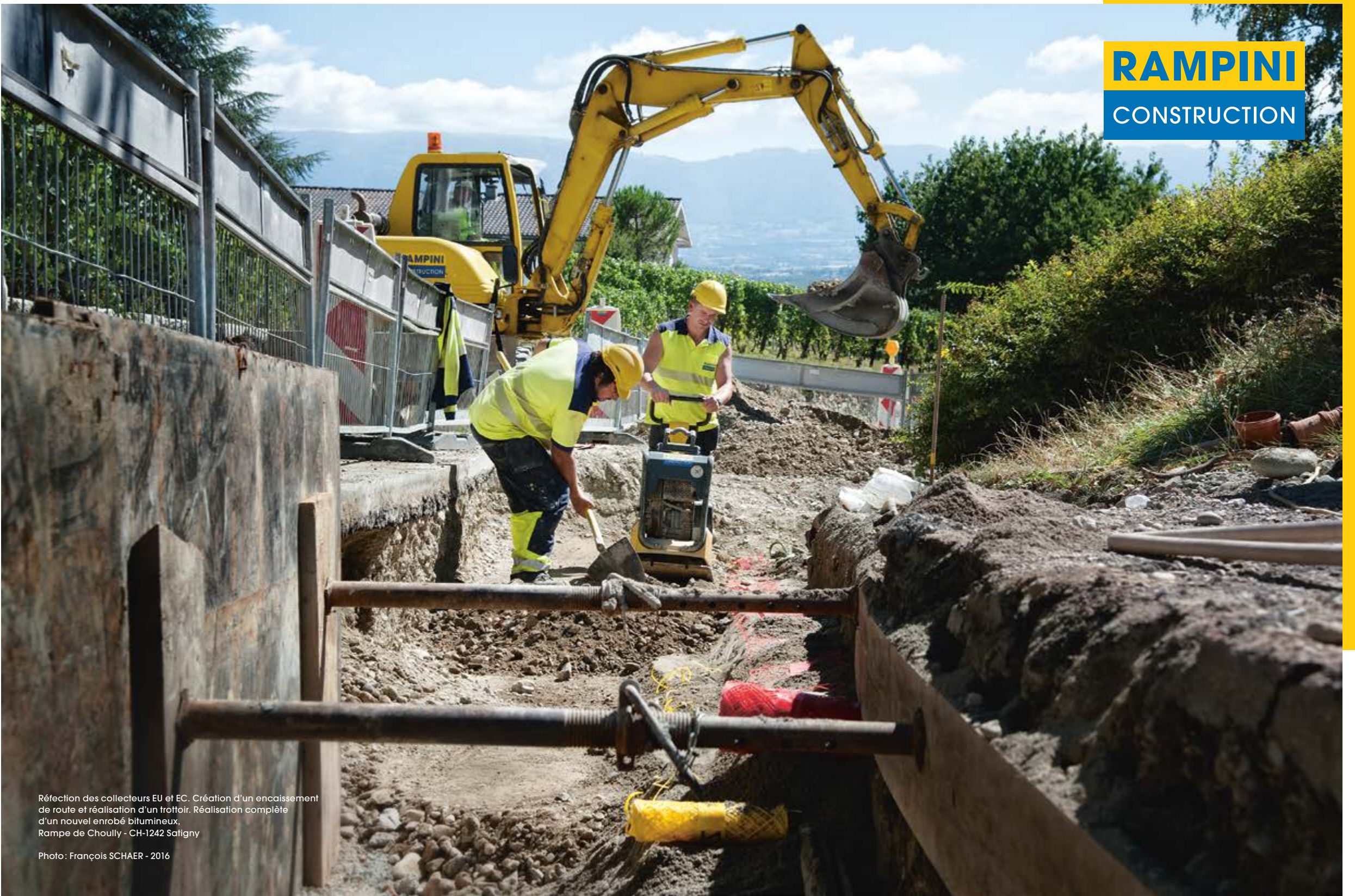
Réfection des collecteurs EU et EC. Création d'un encaissement de route et réalisation d'un trottoir. Réalisation complète d'un nouvel entôbé bitumineux. Rampe de Chouilly - CH-1242 Satigny Photo: François SCHAER - 2016