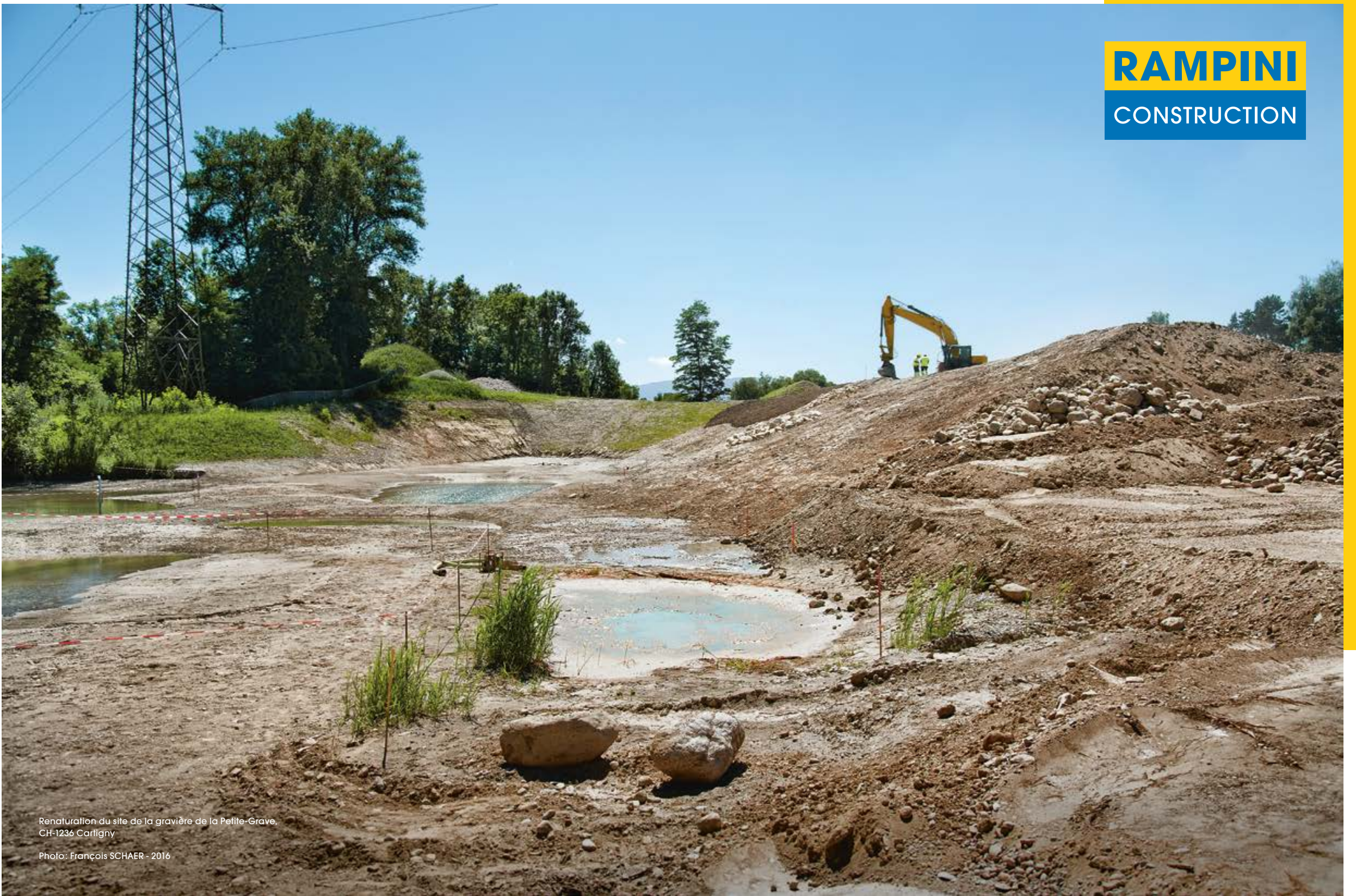
Restauration du site de la gravière de la Petite-Grave, CH-1236 Cortigny Photo: François SCHAER - 2016