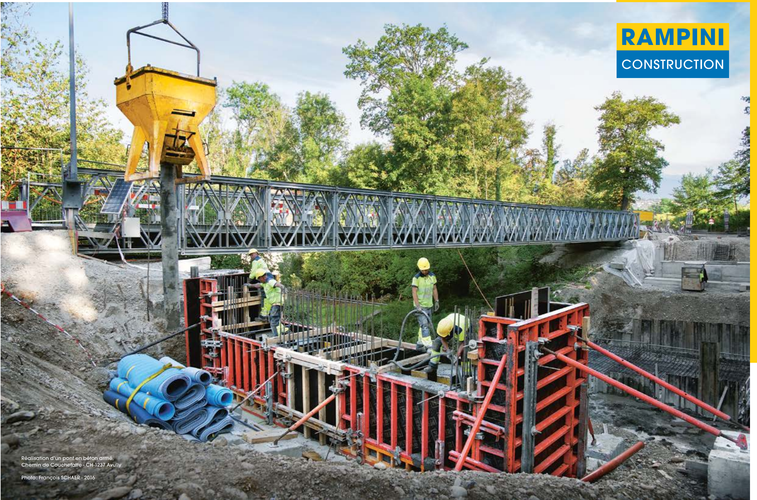
Réalisation d'un pont en béton armé. Chemin de Couchefatte - CH-1237 Avully Photo: François SCHAER - 2016