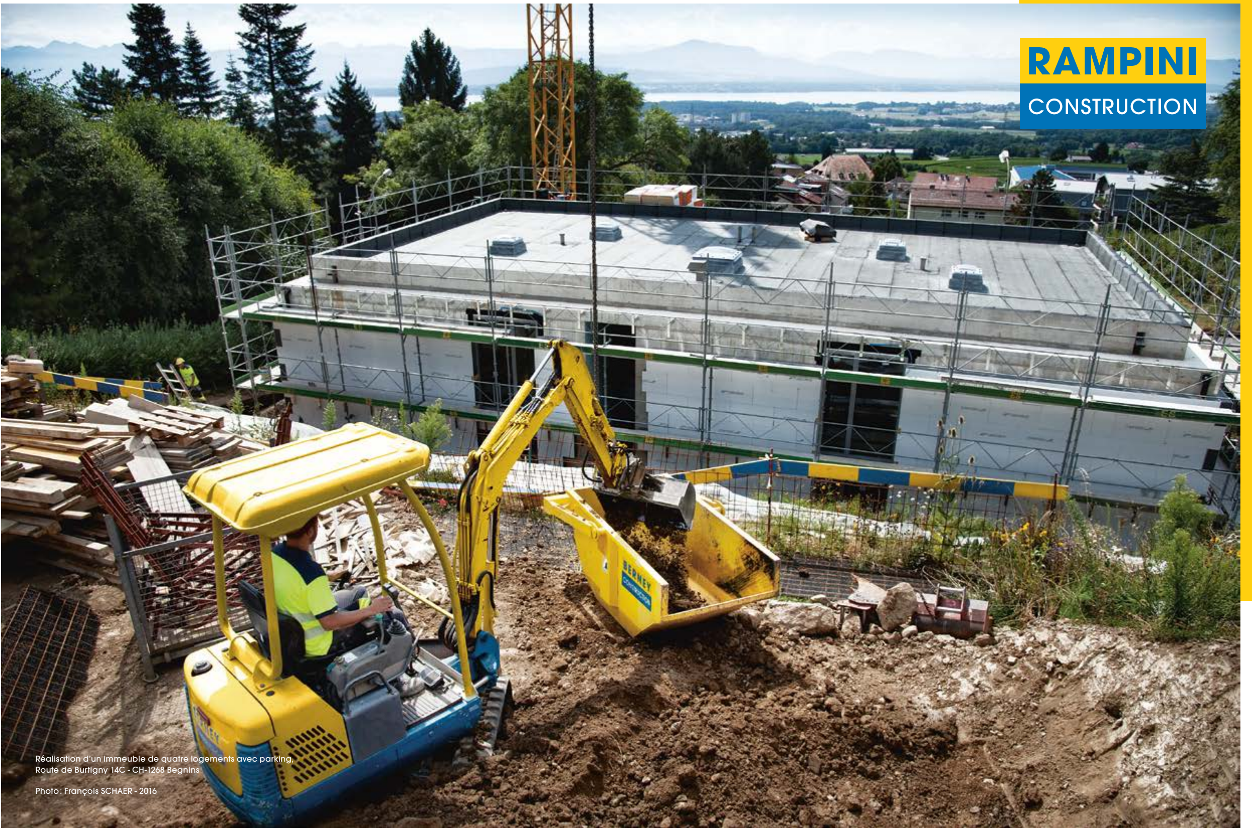
Réalisation d'un immeuble de quatre logements avec parking. Route de Burligny 14C - CH-1268 Begnins Photo: François SCHAER - 2016