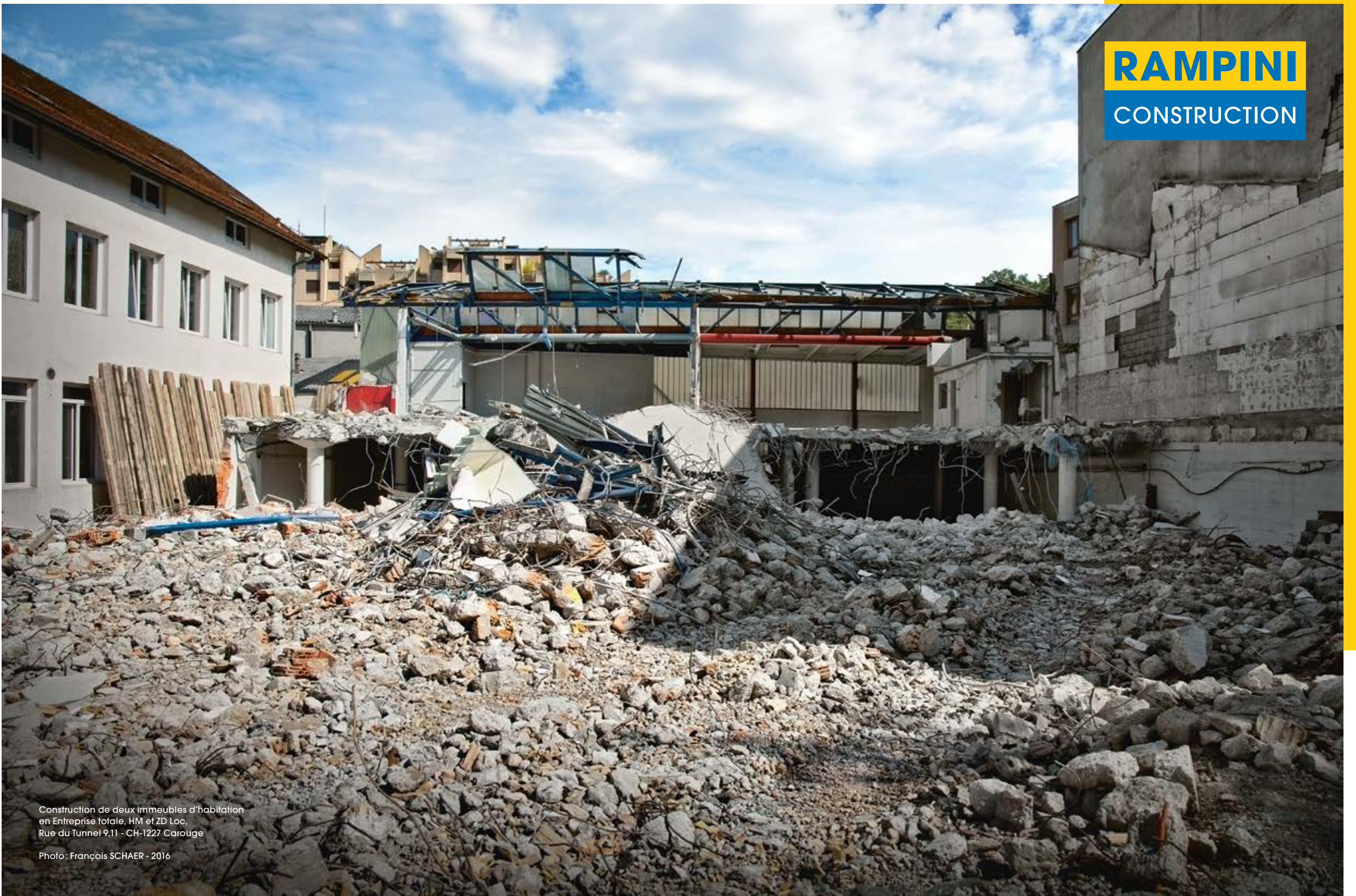
Construction de deux immeubles d'habitation en Entreprise totale, HM et ZD Loc. Rue du Tunnel 9/11 - CH-1227 Carouge Photo: François SCHAER - 2016