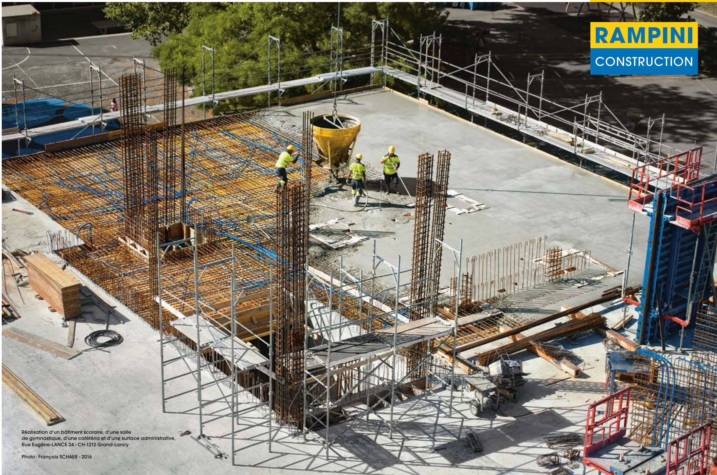
Réalisation d'un bâtiment scolaire, d'une salle de gymnastique, d'une cafétéria et d'une surface administrative, Rue Eugène-LANCE 24 - CH-1212 Grand-Lancy Photo: François SCHAER - 2016