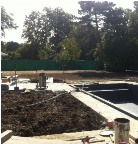
Pendant les travaux