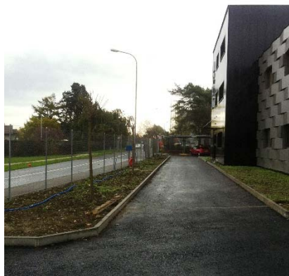
Pendant les travaux