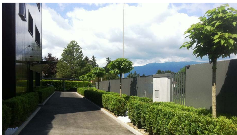
Après les travaux