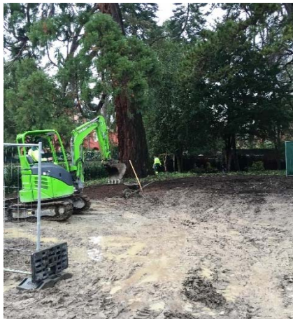
Pendant les travaux