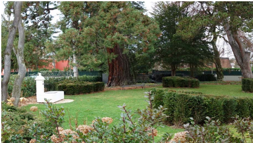
Après les travaux