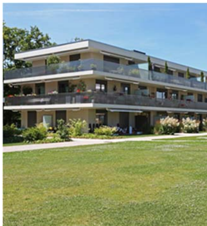
Gazon et plantations