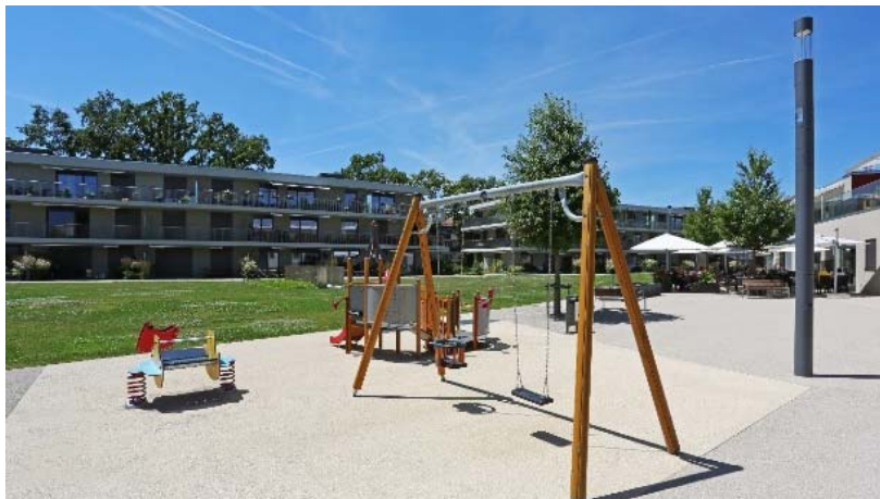
Place de jeux