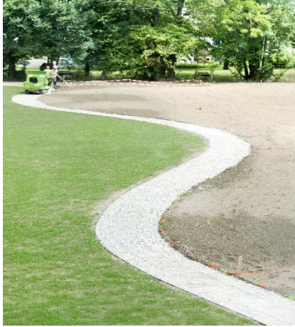
Sous-couche du cheminement