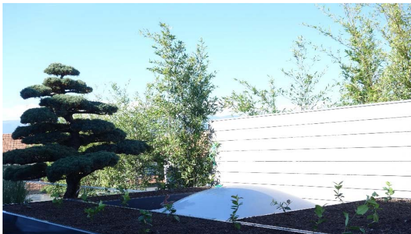
Diverses plantations avec arrosage automatique