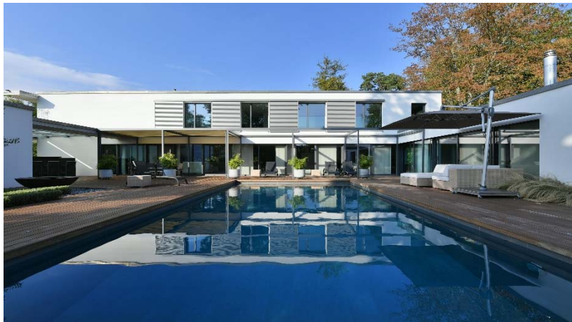
Terrasse en bois exotique