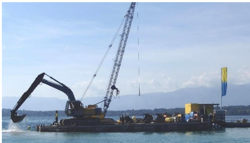
Pendant les travaux d'atterrage zone ensouillée