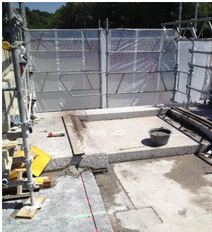
Vue sur le pont pendant les travaux