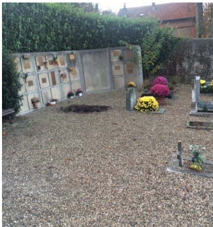
Avant les travaux